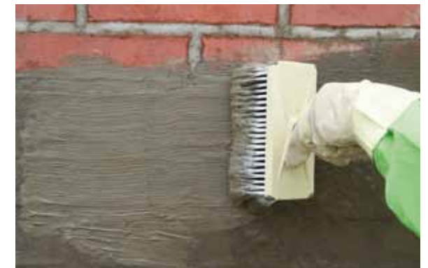
Direkt im Anschluss wird ein weiteres Mal die KÖSTER Kellerdicht 1 Schlämme aufgetragen. Dieser Schritt wird nach 30 Min. noch einmal wiederholt.

Zur Abdichtung feuchter Keller hat die KÖSTER BAUCHEMIE AG das KÖSTER Kellerdicht-Verfahren entwickelt, welches sich schon seit Jahrzehnten bewährt. Damit werden undichte Flächen und Einzelstellen, selbst wenn das Wasser fließt, schnell und einfach abgedichtet. Der Erfolg ist sofort sichtbar.